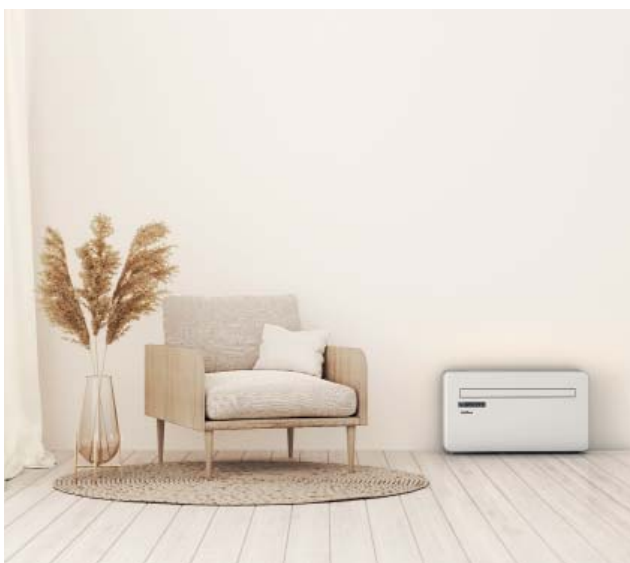
Einsatz als Truhengerät