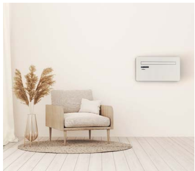
Einsatz als Wandgerät