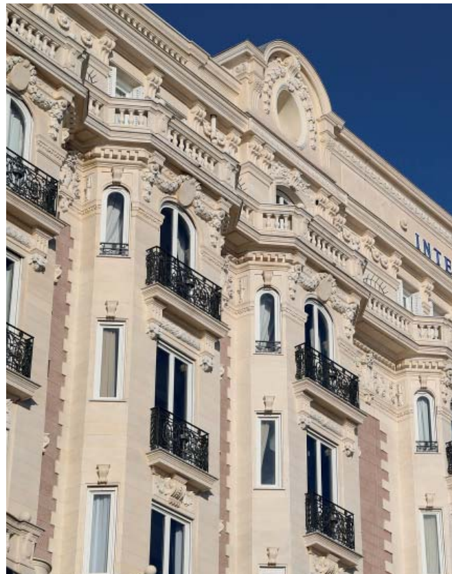
Geeignet für denkmalgeschützte Gebäude

Bauherren, die ein unter Denkmalschutz stehendes Haus umbauen und modernisieren möchten, müssen sich an rechtliche Vorgaben halten und Einschränkungen in Kauf nehmen. Meist sind Außeneinheiten aus Gründen des Denkmalschutzes oder aus ästhetischen Gründen nicht einsetzbar, daher ist ein Monoblock-Klimagerät AirBlue GAW 30 ECO ideal.