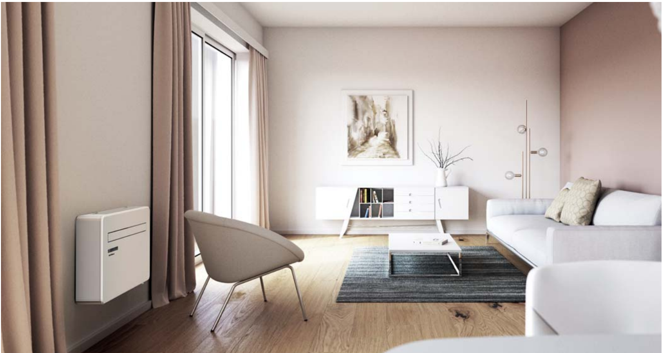
Einsatz als Truhengerät