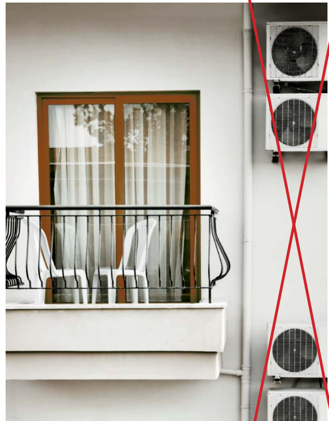
Herkömmliches Split-Klimagerät mit Außeneinheit