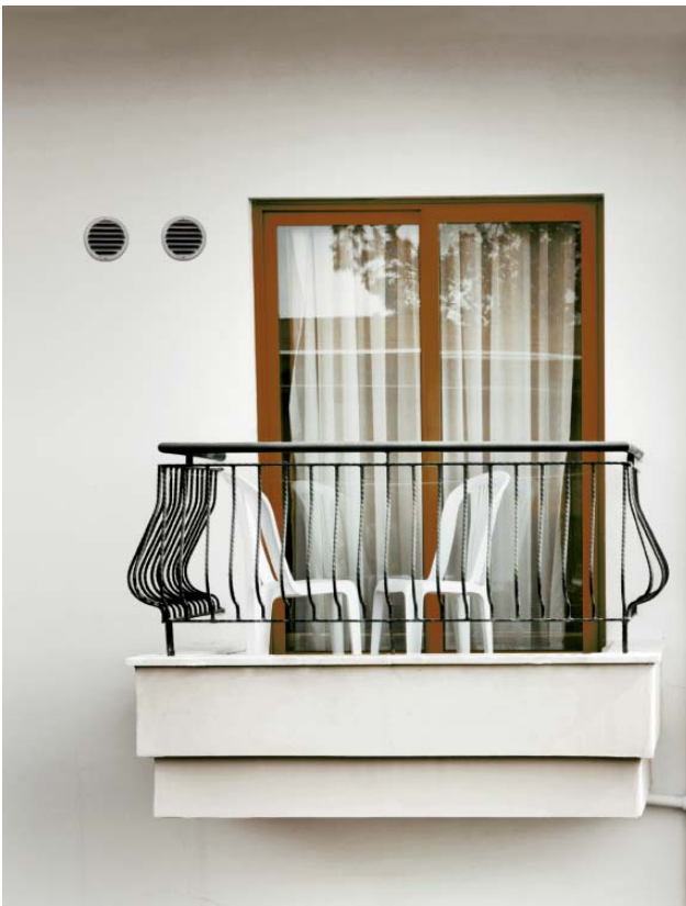
AirBlue GAW 30 ECO: Zwei unauffällige Luftgitter

Das AirBlue GAW 30 ECO stellt nun die neueste Entwicklung des Monoblock-Klimagerätes dar. Minimale Geräusentwicklung und die Erfüllung der hohen Ansprüche in Bezug auf Energieeffizienz und Lautstärke standen hier im Fokus der Entwicklung. Durch das moderne, zurückhaltende und doch charaktervolle Design fügt sich der neue AirBlue GAW 30 ECO unauffällig in jedes Wohnambiente ein.